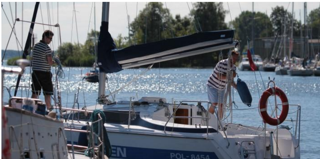
Badania ruchu turystycznego pozwolą poprawić jakość usług w portach jachtowych